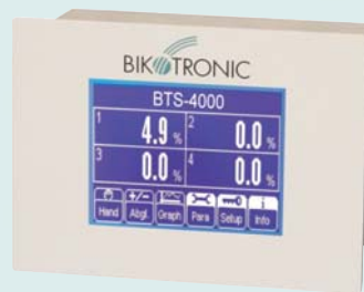
Anzeige- und Auswertegerät